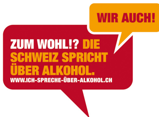
Abbildung 2: Logo Dialogwoche 2011

Einzelne Fachverbände, kantonale Koordinator/innen und Umsetzungspartner/innen haben erwähnt, dass die Sprachblasen gut die Dialogidee veranschaulicht haben.