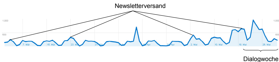
Abbildung 3: Besucherstatistik Webseite

Die Webseite verzeichnete während der Dialogwoche 4'000 absolute eindeutige Besucher/innen, wovon 76% neue Besucher/innen waren. Sie verweilten im Durchschnitt knapp zweieinhalb Minuten auf der Webseite. Im Zeitraum Januar bis Mai 2011 wurden gut 24'000 Besucher/innen verzeichnet welche durchschnittlich dreieinhalb Minuten auf der Webseite verweilten.